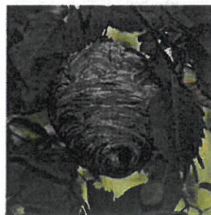
The High Fin Sperm Whale, 2011

De couleur grise, son ouverture de petite taille est située à la base du nid et légèrement excentrée