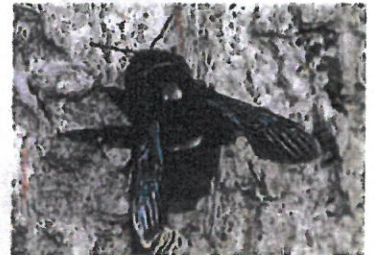
Abeille charpentière Xylocopa violacea (Pierre Falatico, 2010)