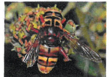
Milésie faux-frelon Milesia crabroniformis (Pierre Falatico, 2009)