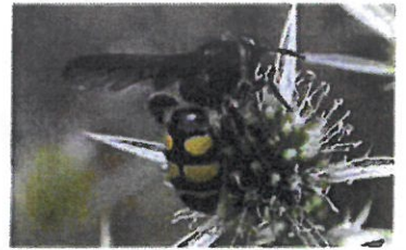
Scolie Colpa sexmaculata (Pierre Falatico, 2010)