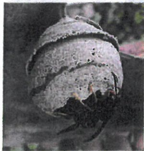
Basile Naillon, 2012

Au printemps, la femelle fondatrice construit seule un nid primaire dans lequel elle élève la première génération d'ouvrières. Ce nid de petite taille est souvent construit à faible hauteur.