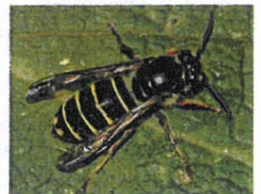
Guêpe des buissons Dolichovespula media (Jeremy Early, 2010)