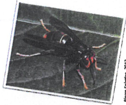
Pierre Falatico, 2013

Le frelon asiatique est très souvent confondu avec le frelon européen. Voici comment les différencier :