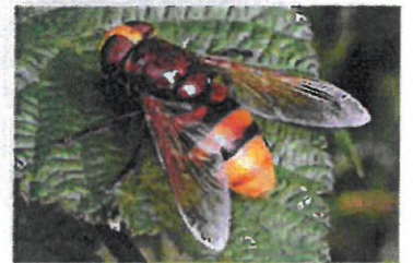
Volucelle zonée Volucella zonaria (Pierre Falatico, 2005)